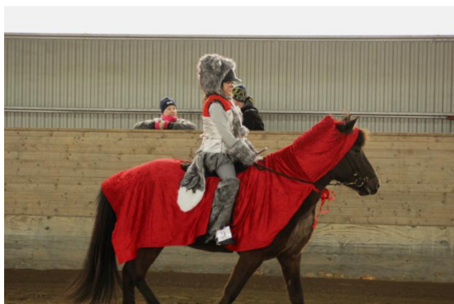
Rödluvan och vargen, nej förlåt, Vargen och Rödluvan.