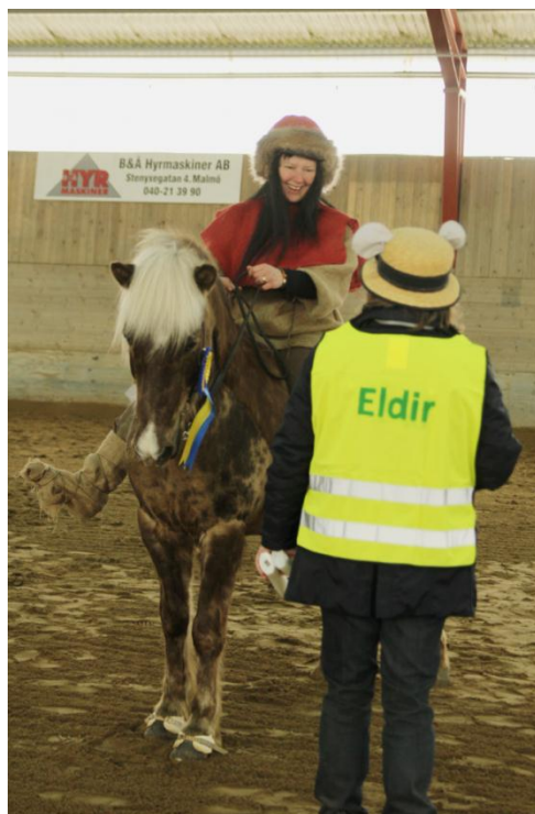
Ronja och hennes springare

Resultat finns även på Eldirs hemsida www.eldir.se