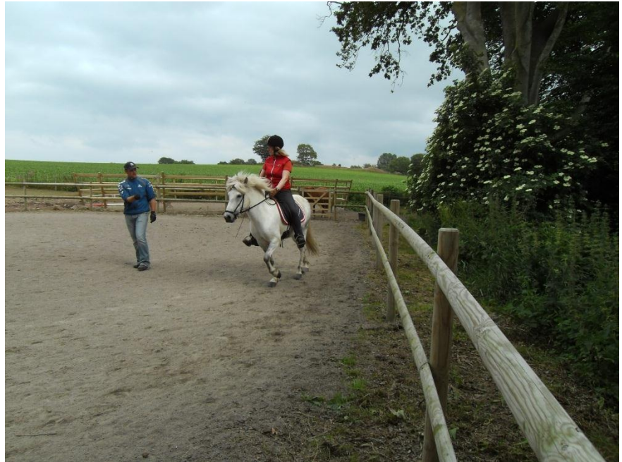
Hinnikurs juli 2012 hos Kullabergs Islandshästar

I januari, närmare 25:e januari, dagen innan årsmötet, hade vi i Gandur årets första Hinni-kurs. Kursen var i Jonstorp (Ridhuset i Södåkra), och denna gången red vi ett enkeltpass i den kalla vintern. Många härliga hästar och duktiga ryttare var med, och det var lika trevligt som alltid att vara med på dessa kurser.