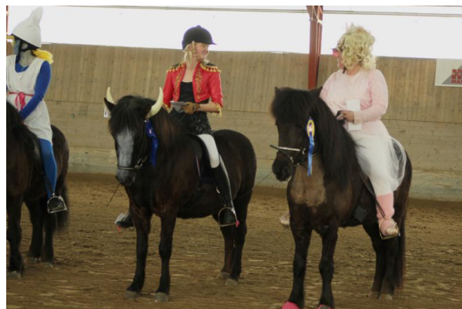
En smurf, Ferdinan och Matadoren samt Piss Piggy